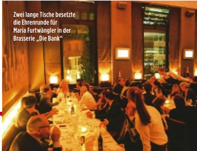
Zwei lange Tische besetzte die Ehrenrunde für Maria Furtwängler in der Brasserie „Die Bank“