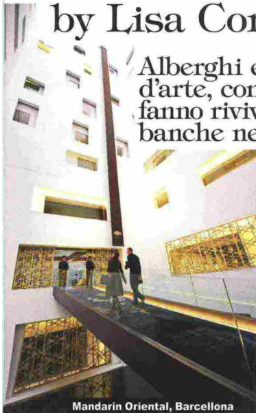
Mandarin Oriental, Barcellona

Alberghi e cocktail bar, ma anche gallerie d'arte, concept store e brasserie luxury fanno rivivere gli edifici ottocenteschi delle banche nel cuore della vecchia Europa