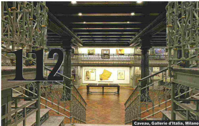
Caveau, Gallerie d'Italia, Milano