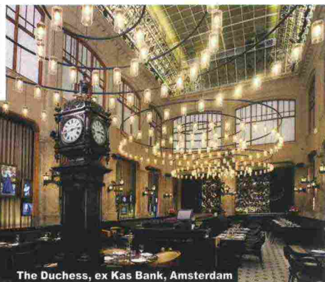
The Duchess, ex Kas Bank, Amsterdam

no, il Grand Palace Hotel a Riga, e l'Hôtel Le St-James a Montréal, dove il centro benessere è ospitato nel caveau dell'ex Merchants Bank, del 1870. Dai cinque stelle alle brasserie luxury: Belga Queen è in un'ex banca di Bruxelles (www.belgaqueen.be), mentre Die Bank (diebank-brasserie.de) è ad Amburgo, una delle città tedesche più chic. Nell'ex sede della Hypothekenbank, del 1897, ora ci si siede a tavola per mangiare un'aragosta. E per finire, un bicchierino di Old Tawny Port, in omaggio ai traffici di uno dei più bei porti della vecchia Europa.